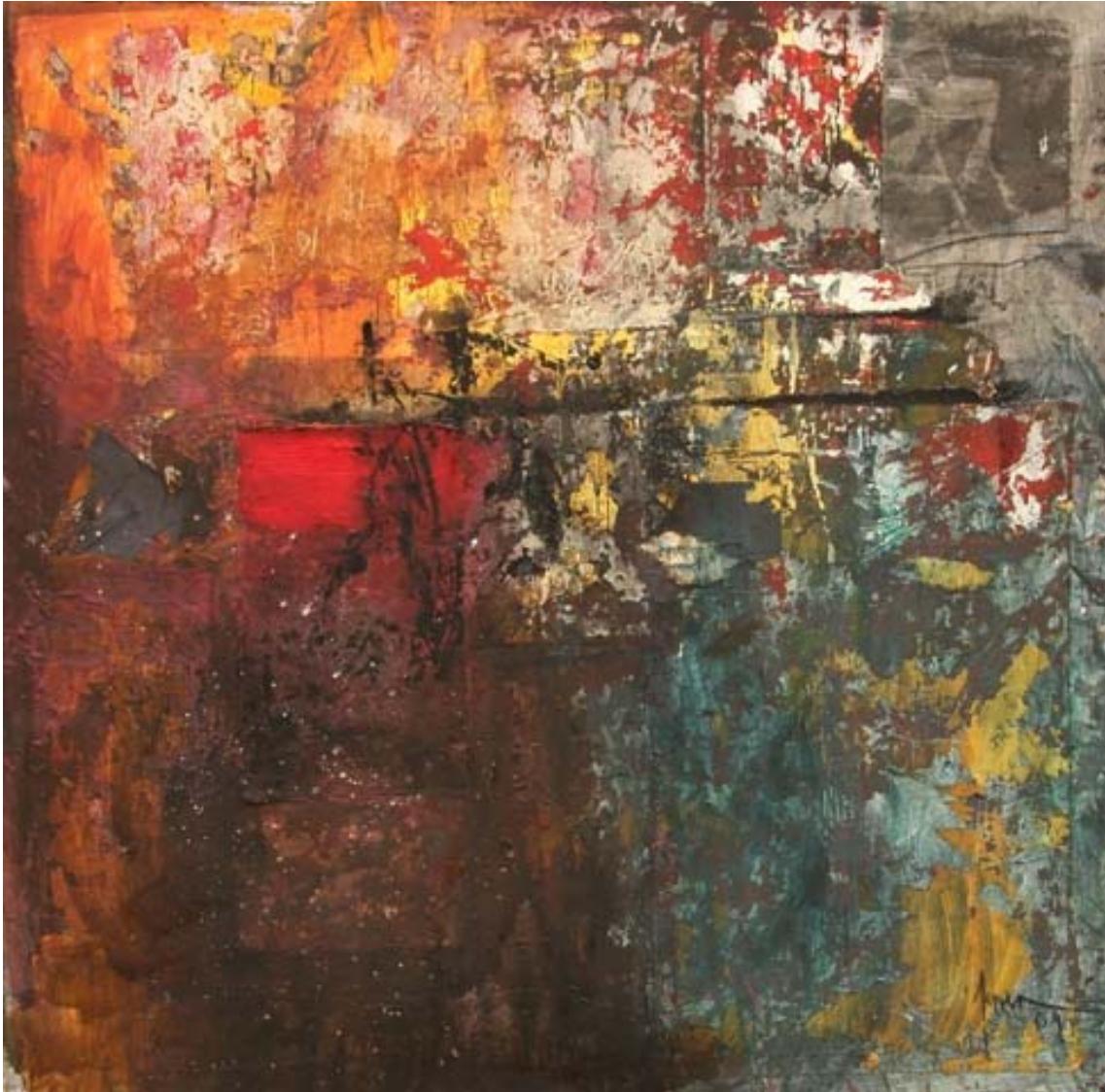
“La esquina del pecado”